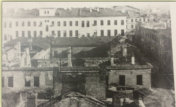
Разрушенный бомбами и снарядами Поперечный корпус Института

«Слава вам, которые в сраженьях отстояли берега Невы. Ленинград, ненавший поражения, новым светом озарили вы» Вера Инбер