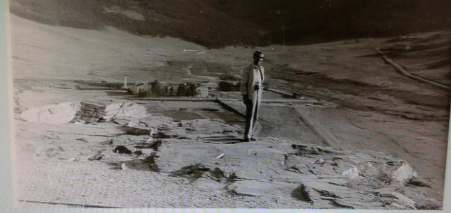
В Монголии, 1983 г. возвращение на места старых научных исследований