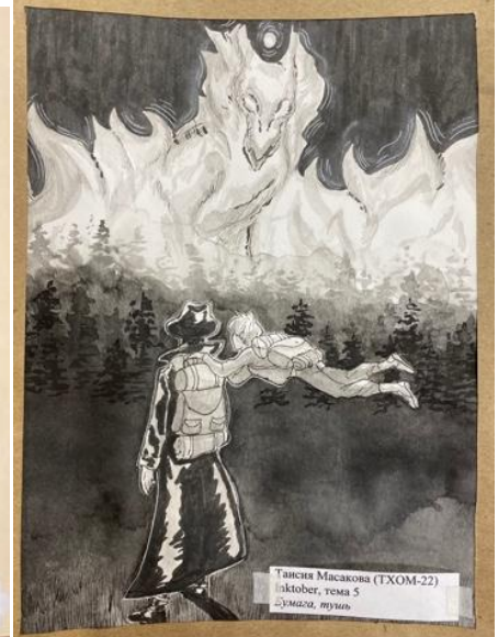
Таняна Масикова (ТХОМ-22) Октябрь, тема 5 Думача, туш