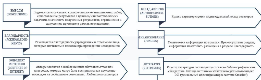
Рисунок 3. Структура научной публикации

2.2. Как правило, научная статья состоит из 3 частей: метаданные (титульная часть), основной текст статьи, справочные данные (табл. 1). Их состав и структура могут изменяться, в зависимости от требования издания, характера публикации, а также стиля авторов.