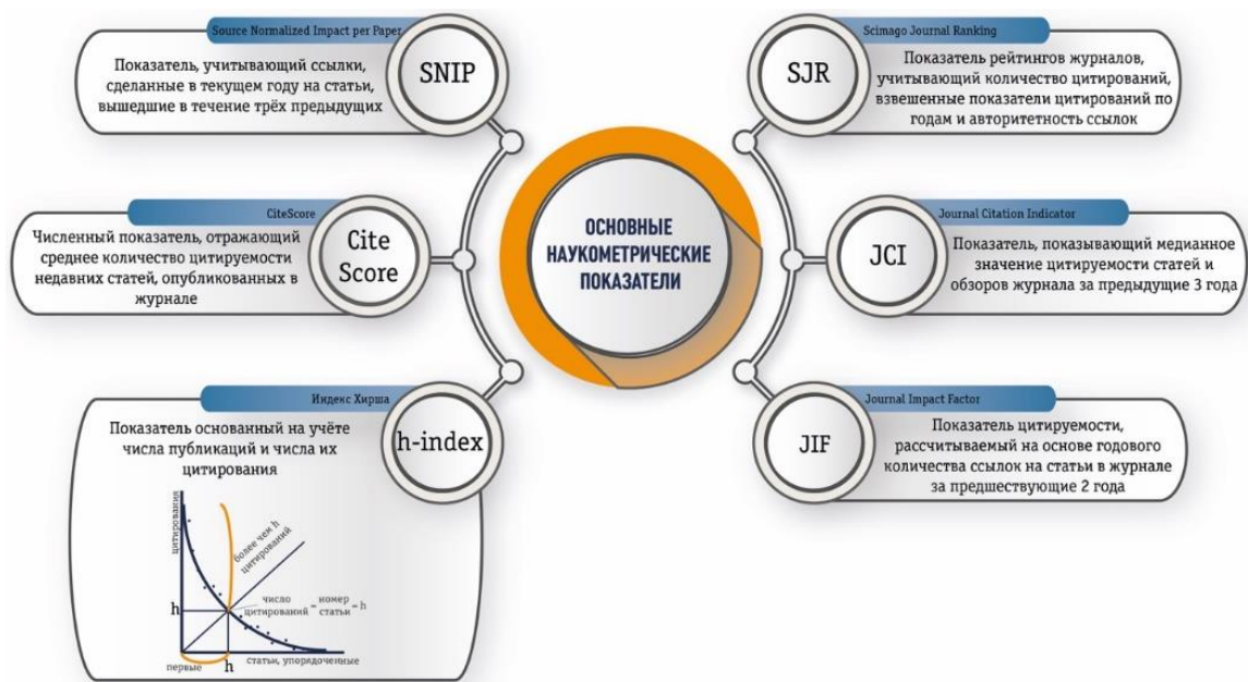
Рисунок 7. Основные наукометрические показатели журналов

Ежегодно публикуется более 2,5 миллионов научных статей, и это число постоянно растет. Поэтому для авторов становится все более важным найти способы выделить свою статью. В век социальных сетей, онлайн сетей и масштабного распространения информации у авторов существует огромное разнообразие возможностей (рис. 8) для широкого продвижения своих опубликованных исследований среди коллег, СМИ и широкой общественности. Можно сформулировать несколько основных рекомендаций: