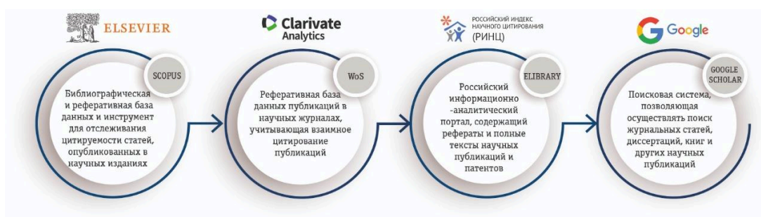
Рисунок 4. Основные научные базы данных

Наиболее часто используемыми МНБД являются Scopus, Web of Science и Google Scholar. В России, например, в силу национальной специфики, – РИНЦ (Российский индекс научного цитирования) (рис. 4).