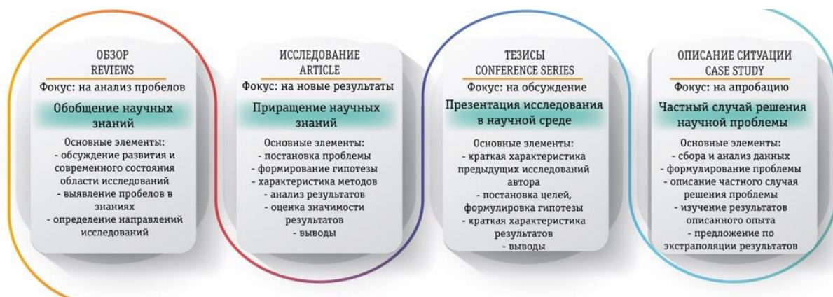
Рисунок 2. Типы научных публикаций

Отдельно обозначаются тезисы докладов, в которых кратко (порядка 1-2 тыс. знаков) отражается суть выступления, без детального описания методики исследования, с кратким списком литературы (около 3 ключевых источников) и со сжатым изложением выводов. Этот вид публикаций не может считаться полноценной научной статьей.