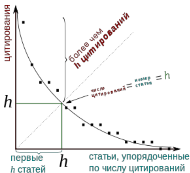
Рисунок 6. Порядок определения индекса Хирша (рисунок находится в открытом доступе в сети Интернет)

Индекс Хирша рассчитывается на основе всех публикаций учёного (подразделения, организации), индексируемых в наукометрической базе, хотя, существуют и примеры его модификаций с учетом конкретных временных диапазонов, а также производные показатели, такие как I5 (число статей с не менее чем 5 цитированиями), I10 и т.п.