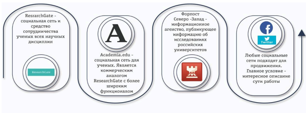
Рисунок 8. Основные инструменты для продвижения научных публикаций

Ежегодно публикуется более 2,5 миллионов научных статей, и это число постоянно растет. Поэтому для авторов становится все более важным найти способы выделить свою статью. В век социальных сетей, онлайн сетей и масштабного распространения информации у авторов существует огромное разнообразие возможностей (рис. 8) для широкого продвижения своих опубликованных исследований среди коллег, СМИ и широкой общественности. Можно сформулировать несколько основных рекомендаций: