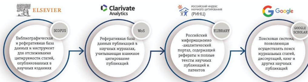
Рисунок 4. Основные научные базы данных

Наиболее часто используемыми МНБД являются Scopus, Web of Science и Google Scholar. В России, например, в силу национальной специфики, – РИНЦ (Российский индекс научного цитирования) (рис. 4).