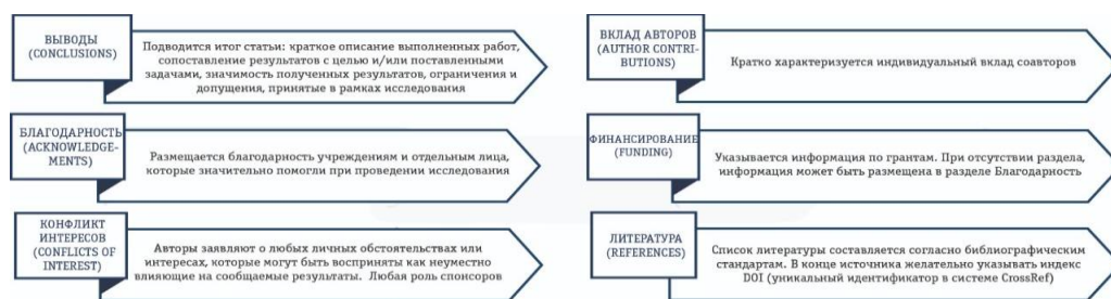
Рисунок 3. Структура научной публикации

2.2. Как правило, научная статья состоит из 3 частей: метаданные (титульная часть), основной текст статьи, справочные данные (табл. 1). Их состав и структура могут изменяться, в зависимости от требования издания, характера публикации, а также стиля авторов.