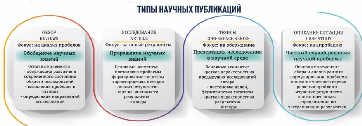
Рисунок 2. Типы научных публикаций

в знаниях и определения перспективных направлений дальнейшей работы в данной области.