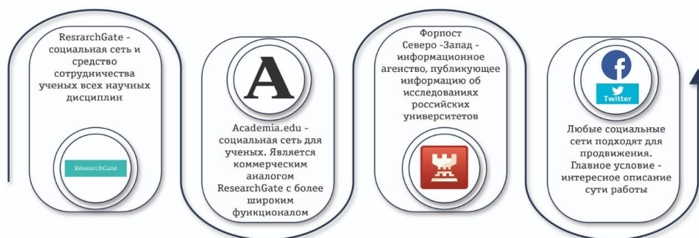
Рисунок 8. Основные инструменты для продвижения научных публикаций

1. Необходимо создавать профили авторов во всех доступных системах. Регистрация профилей авторов в Google Scholar, Microsoft Academic и других подобных сервисах значительно улучшает видимость их публикаций и, соответственно, способствует продвижению результатов исследований и расширению академических контактов.