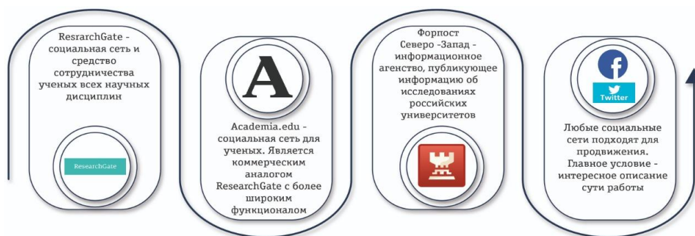
Рисунок 8. Основные инструменты для продвижения научных публикаций

1. Необходимо создавать профили авторов во всех доступных системах. Регистрация профилей авторов в Google Scholar, Microsoft Academic и других подобных сервисах значительно улучшает видимость их публикаций и, соответственно, способствует продвижению результатов исследований и расширению академических контактов.