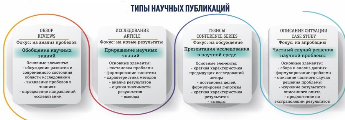
Рисунок 2. Типы научных публикаций

- научный обзор представляет собой систематическое описание и анализ текущего состояния теоретических и прикладных исследований, либо освещение задокументированного практического опыта, с целью выявления существующих пробелов в знаниях и определения перспективных направлений дальнейшей работы в данной области.