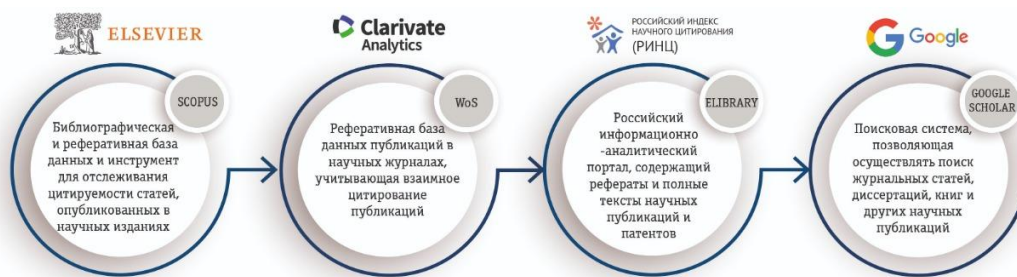
Рисунок 4. Основные научные базы данных

Публикации в базах данных Scopus и WoS это более престижно, так как результаты исследований увидит мировое научное сообщество. Исключением являются студенческие статьи (в соавторстве с сотрудниками-научными руководителями), а также статьи аспирантов и докторантов, которые, помимо Scopus/WoS и ВАК могут ориентироваться на ядро РИНЦ.