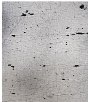
Рис.2. – Микроструктура стали с неметаллическими включениями.

Задача №3. Приведите сравнения исходной структуры стали (Рис.2) с эталонными изображениями неметаллических включений. Укажите бальность неметаллических включений.