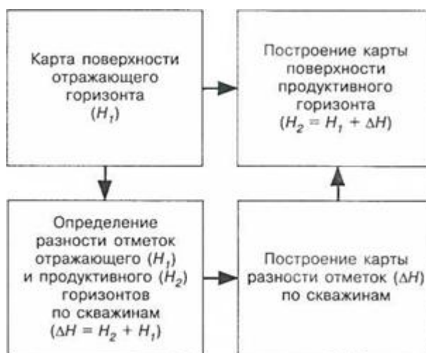
Рис. 5. Схема уточнения структурной карты кровли пласта методом схождения

Существуют различные способы построения структурных карт. Одним из наиболее простых и применяемых (особенно в период до массового использования специализированных программных комплексов) способов построения структурных карт по данным скважин является способ треугольников.