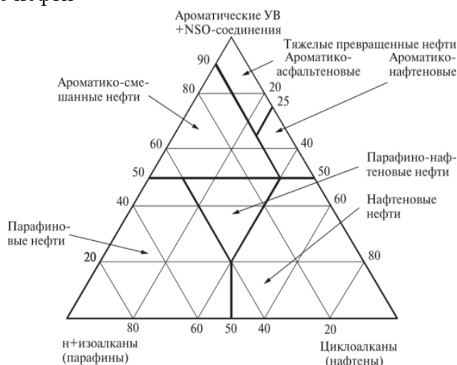
Рис. 3. Классификация нефти по химическому составу

Компонентный состав нефти – выделение групп компонентов, отличающихся друг от друга по агрегатному состоянию, в процессе хроматографического разделения [Бармина 2009].