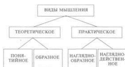
Рис. 51. Основные виды мышления у человека

Теоретическое понятийное мышление — это такое мышление, пользуясь которым человек в процессе решения задачи обращается к понятиям, выполняет действия в уме, непосредственно не имея дела с опытом, получаемым при помощи органов чувств. Он обсуждает и ищет решение задачи с начала и до конца в уме, пользуясь готовыми знаниями, полученными другими людьми, выраженными в понятийной форме, суждениях, умозаключениях. Теоретическое понятийное мышление характерно для научных теоретических исследований.