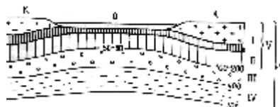
Рис. 3.4. Схема соотношения литосферы, астеносферы и тектоносферы.

При этом устойчивая минеральная ассоциация пиролитового состава в процентах выглядит следующим образом: оливин - 57, ортопироксен - 17, клинопироксен - 12, гранаты - 14. В этих минералах кремний находится в четверной координации, а магний, железо и кальций - в шестерной и восьмерной. Молекулярное отношение Fe/(Fe+Mg) в пиролите составляет 11%.