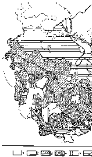
Рис. 7.11. Схема зональности грунтовых вод западной части СССР

Указанная гидрогеохимическая зональность характерна для ряда артезианских бассейнов. Вместе с тем в некоторых бассейнах (Западно-Сибирском, Брестском и др.) сульфатная зона отсутствует, и пресные гидрокарбонатные воды верхней зоны постепенно сменяются хлоридными. По-видимому, та или иная гидрогеохимическая зональность артезианских бассейнов определяется рядом природных факторов: историей развития геологической структуры; условиями водообмена; составом и степенью растворимости водоносных горных пород; соотношением давления и температуры; газовыми компонентами. Именно взаимодействие различных природных факторов и определяет изменение минерализации и состава подземных вод в артезианских бассейнах.