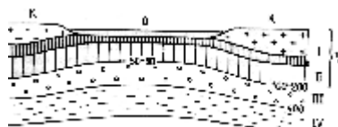
Рис. 3.4. Схема соотношения литосферы, астеносферы и тектоносферы.

При этом устойчивая минеральная ассоциация пиролитового состава в процентах выглядит следующим образом: оливин - 57, ортопироксен - 17, клинопироксен - 12, гранаты - 14. В этих минералах кремний находится в четверной координации, а магний, железо и кальций - в шестерной и восьмерной. Молекулярное отношение Fe/(Fe+Mg) в пиролите составляет 11%.