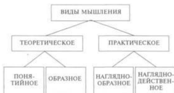
Рис. 51. Основные виды мышления у человека

Теоретическое понятийное мышление — это такое мышление, пользуясь которым человек в процессе решения задачи обращается к понятиям, выполняет действия в уме, непосредственно не имея дела с опытом, получаемым при помощи органов чувств. Он обсуждает и ищет решение задачи с начала и до конца в уме, пользуясь готовыми знаниями, полученными другими людьми, выраженными в понятийной форме, суждениях, умозаключениях. Теоретическое понятийное мышление характерно для научных теоретических исследований.