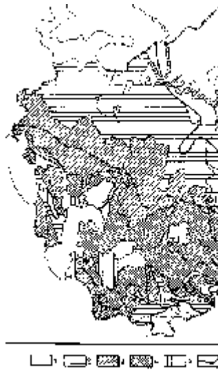
Рис. 7.11. Схема зональности грунтовых вод западной части СССР

По мере значительного увеличения минерализации с глубиной в хлоридно-натриевых рассолах наблюдается рост содержания иона \text{Ca}^{2+} и в наиболее погруженных частях бассейна встречаются хлоридно-кальциевые или хлоридно-кальциево-магниевонатриевые рассолы, что имеет большое значение для нефтяной гидрогеологии. В глубоких водоносных горизонтах с высокой минерализацией, помимо основных анионов и катионов, нередко содержатся йод, бром, бор, стронций, литий, радиоактивные элементы. Особенно большое количество йода, брома и бора встречается в хлоридно-кальциевых водах нефтяных и газовых месторождений, где они местами извлекаются в промышленных количествах.