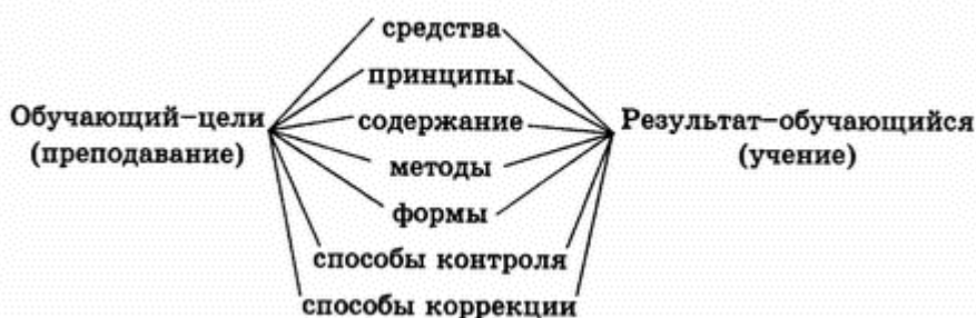
Схема процесса обучений как системы

Процесс обучения - это своеобразная система, характеризующая жизнедеятельность человеческого общества. Поэтому она имеет свои основополагающие положения, которые определяют характер процесса обучения и его специфику. Например, даже конкретная школа (или вуз) - это тоже система, которая имеет свой устав и руководствуется какими-то наиболее общими положениями, которые определяют характер ее жизнедеятельности.