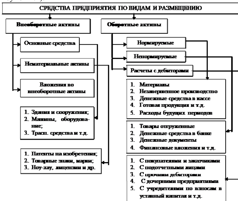
Рисунок 1.1. Средства предприятия по видам и размещению

Средства предприятия по видам и размещению подразделяются на внеоборотные активы и оборотные активы (рисунок 1.1).