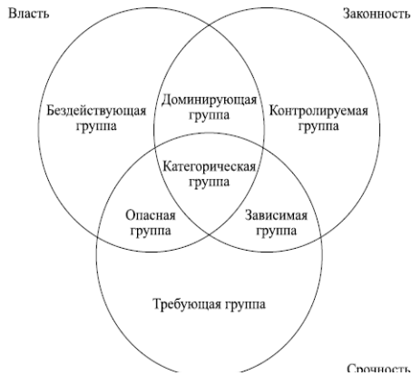
Рис. 1 Модель идентификации значимости заинтересованных сторон

Проведите анализ выявленных в задании 9 групп стейкхолдеров в соответствии с моделью Митчелла (рисунок 1).