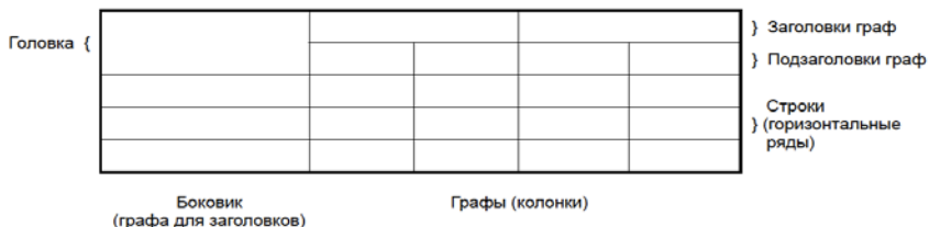
Рис.2. Пример оформления таблицы

боковик заменять соответственно номерами граф и строк. При этом нумеруют арабскими цифрами графы и (или) строки первой части таблицы. Таблица оформляется в соответствии с рис.2.