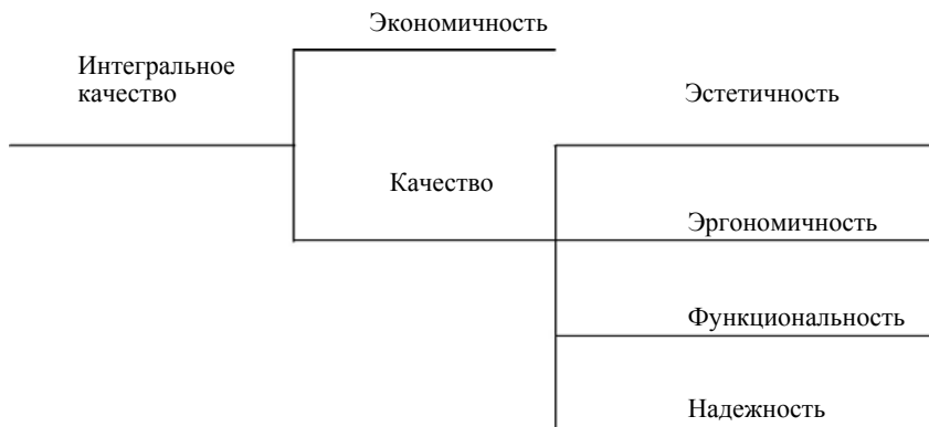
Рис. 3. Начальные уровни дерева общих свойств

5. Начальные уровни дерева свойств могут быть получены как частные случаи дерева общих свойств (рис. 3).